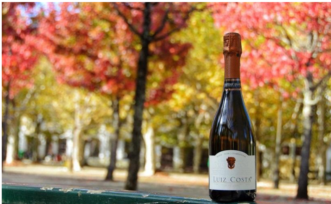
Luiz Costa Pinot Noir & Chardonnay 2015 – 4.ª Edição, de Caves São João

Región de Bairrada, mejor espumoso y mejor ratio entre muestras enviadas y premios obtenidos: 2 medallas de “Gran Oro”, 8 “Oros” y 22 “Platas”